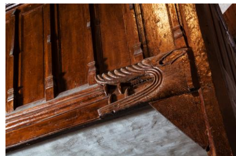
Buffet classé avec « engoulants » comme aux Hospices de Beaune